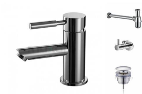
Varono Waschtischarmatur Serie Cinqua 55.003.561