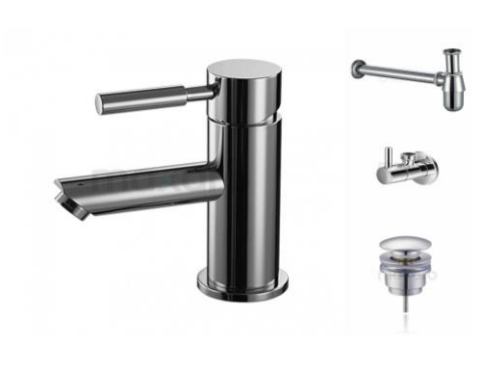
Varono Waschtischarmatur Serie Cinqua 55.003.561