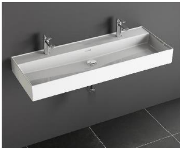
Doppelwaschbecken 120x47 cm